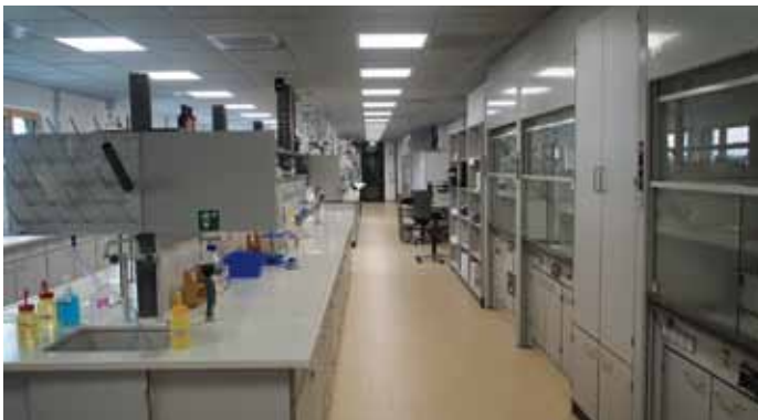
Unser neues GMP-Labor! Our new GMP-Laboratory!

We are proud to have reached with this investment another milestone in the development of Hedinger.