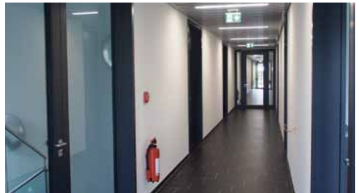
Viel Raum für neue Ideen! Lot of space for new ideas!