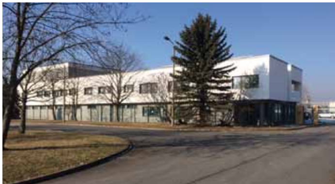
Das neue Gebäude nach Fertigstellung! The new building!

Background: CO 2 -Emission can be balanced with climate protection projects. To make sure that the projects make sense, a group of international scientists together with NGOs and with the WWF in the lead have developed a „Gold-Standard“ for climate-projects in developing countries. All projects offered by natureOffice are certified against this Gold Standard. The main compensation of CO 2 -Emission from the catalogue printing is covered by a certified reforestation program located in Togo (Africa), but at the same time the company supports the regional environment protection in the black forest by choosing the „Deutschland Plus“ project. Deutschland Plus is the first certificate developed between natureOffice and Bergwaldprojekt e.V., that connect the certified CO 2 -compensation together with a nature-award for German forests and fens. They make sure that the funds are invested what the customer has decided for.