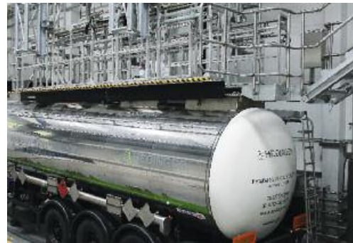
Fast kindersicher. Das routinemäßige Begehen der Tankwagen ist hier auch bei einem Fehltritt risikolos.

(Beeindruckender ist natürlich ein Besuch mit Blick auf die Details.)