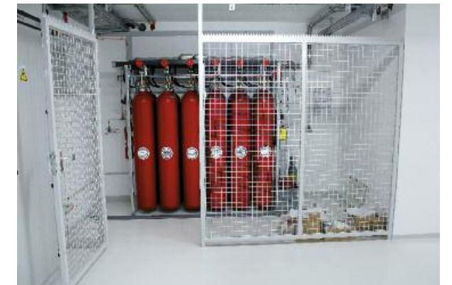
Effektive CO2-Löschanlage. Eine Sicherheits-einrichtung, die hoffentlich nie zum Einsatz kommen wird.