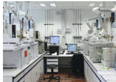
Kein Wareneingang von Tankwagenlieferungen ohne Laborkontrolle.