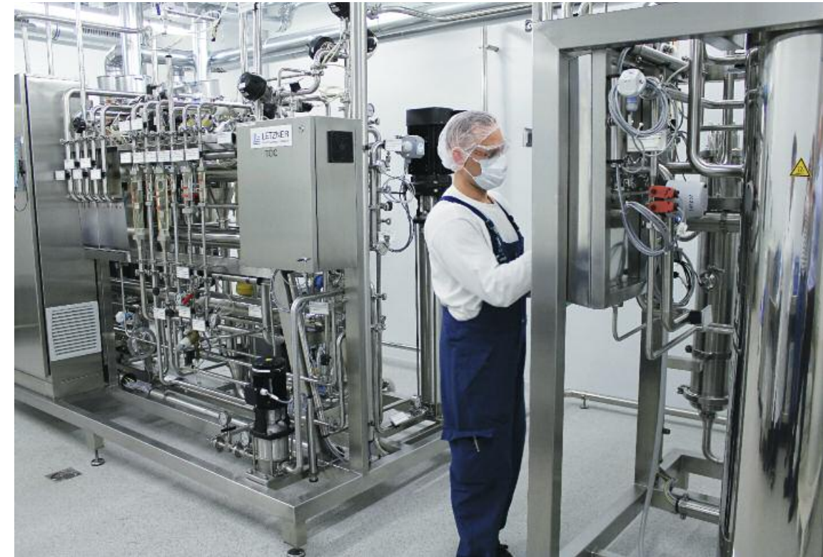
Die neue Wasseraufbereitungsanlage: Die Kapazität der Anlage beträgt 1000 l/h. Aufbereitungsschritte sind Enthärtung, Reversosmose, Elektrodeionisation, Ultrafiltration. Die Anlage ist thermisch sanitisierbar; das heißt, sie kann sozusagen per Knopfdruck auf Temperaturen von min. 80 °C erhitzt werden, um eventuelle mikrobiologische Kontaminationen zu entfernen. Die Anlage produziert hochgereinigtes Wasser Ph. Eur.