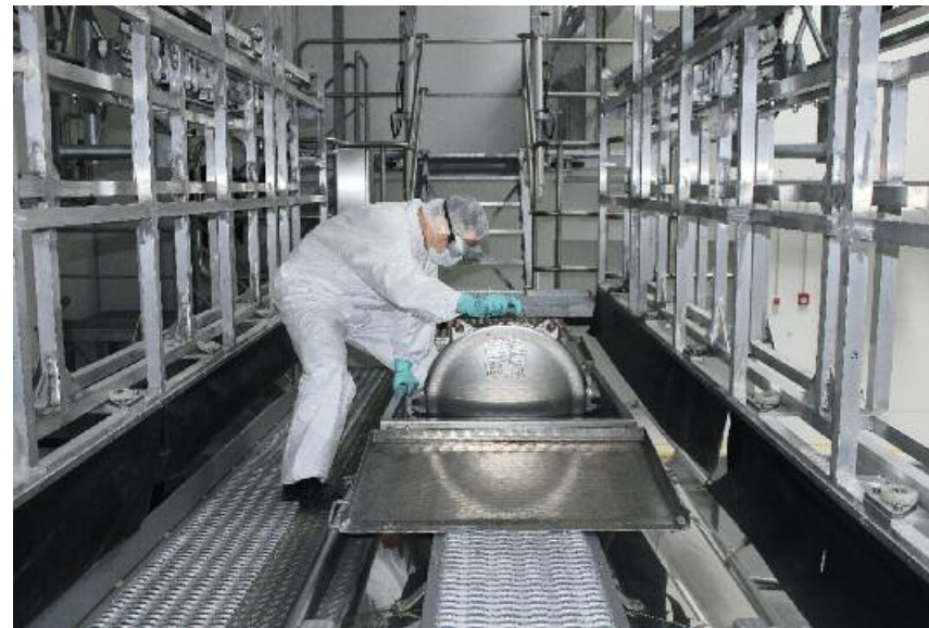
Probenahmen und optische Prüfung nur noch in geschütztem Umfeld. Hoher Schutz für Mensch und Produkt.