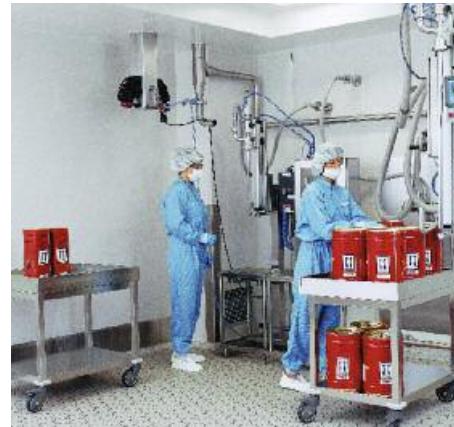
Zwischen 1000 Litern und 1 Liter – jeder Kundenwunsch ist möglich.