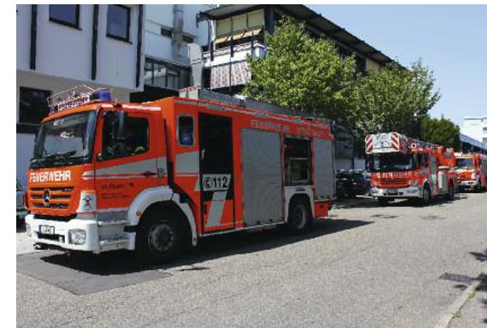
Die Stuttgarter Feuerwehr ist mit allen Einrichtungen des Unternehmens bestens vertraut. Die Brandmeldeanlage hat eine direkte Leitung zur Feuerwehr. Alarmläufe umgehen bei der Feuerwehr auf.