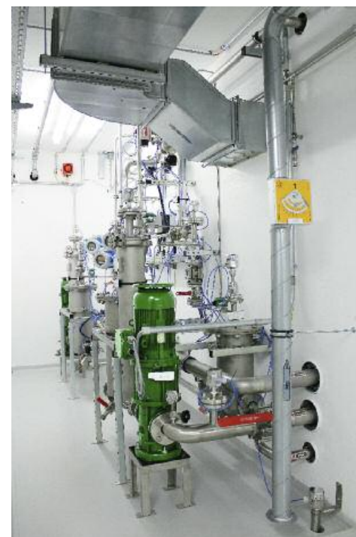
Hochreine Lösemittelfilter. Kleinste Partikel werden in zweistufiger Filtration entfernt.