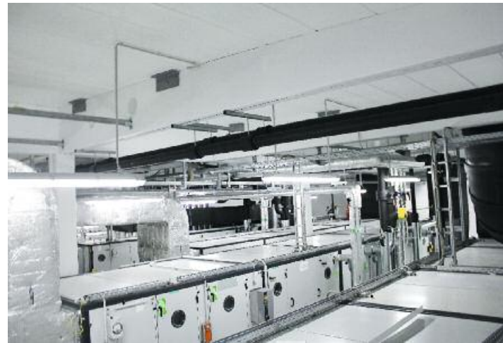
Bis zu 14.000 m 3 pro Stunde werden als Zuluft gereinigt, um Kontaminationen bei den Reinraumabfüllungen auszuschließen.